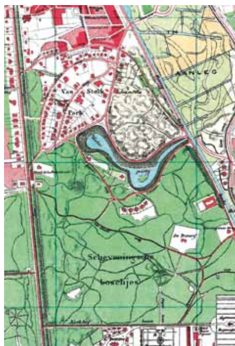
Kaart Scheveningen e.o., Smulders, 1900

Dat echte specifieke duinlandschap werd na de Napoleontische tijd aan het begin van de 19e eeuw niet door iedereen zo positief beoordeeld. Naar de maatstaven van die tijd ging het om woeste gronden. Sommigen vonden dat die maar snel tot nut gemaakt moesten worden. Ontginnen dus, afgraven en akkers aanleggen. Het vrijgekomen zand kon goed gebruikt worden bij de aanleg van wegen en het dempen van de stinkende grachten in Den Haag. Op deze manier ging de Scheveningse 'wildernis' steeds meer economische betekenis krijgen. Temeer daar de afgegraven gronden ook goede mogelijkheden boden voor bebouwing. De ontwikkeling van de badplaats was daar trouwens meer debet aan dan de landbouw. Maar hoe dan ook, het duingebied werd steeds meer deel van de bewoonde wereld. De Badhuisstraat en de Keizerstraat met de omliggende buurten begonnen rond 1850 aan een duidelijke groei. De Kanaalweg, aanvankelijk een onverhard duinpad, werd in 1848-1851 ver-