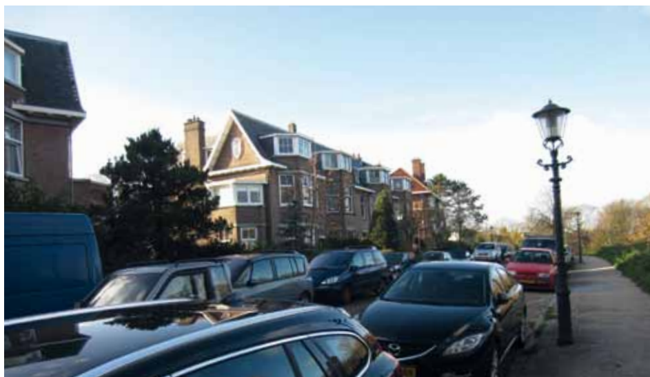
Najaar 2015 - een volle Gerbrandyweg

van de straat en de Van Stolkweg aan de kant van het VCL (vanaf het pleintje de linkerzijde). Laden en lossen mag wel aan de niet-parkeerzijde. Daarmee is even boodschappen uitladen voor de deur of een mindervalide persoon uit de auto helpen mogelijk, mits daarna maar op een legale plek wordt geparkeerd.