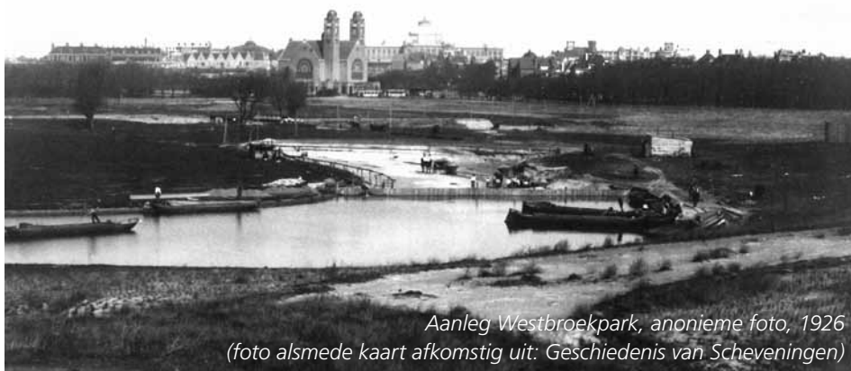
Aanleg Westbroekpark, anonieme foto, 1926 (foto alsmede kaart afkomstig uit: Geschiedenis van Scheveningen)