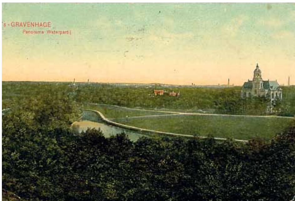
Huize Ten Vijver en links daarvan het complex van koetshuis en stallen langs de Dwarsweg in 1912.

geweest. Op 16 juni 1885 namen Burgemeester en Wethouders van 's-Gravenhage een besluit tot naamgeving van de wegen in het Van Stolkpark. De weg 'tusschen den Cremerweg en den Hoogeweg' kreeg de naam Dwarsweg. Na de sloop van Huize Ten Vijver en de villa's langs de Cremerweg in 1943 stonden er geen huizen meer langs deze wegen en werd in 1945 besloten de naam Dwarsweg te laten vervallen en de Cremerweg te beperken tot het niet-aangetaste deel tussen de Cremerbrug en de Nieuwe Parklaan.