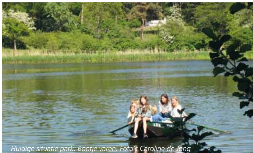
Huidige situatie park: Bootje varen.