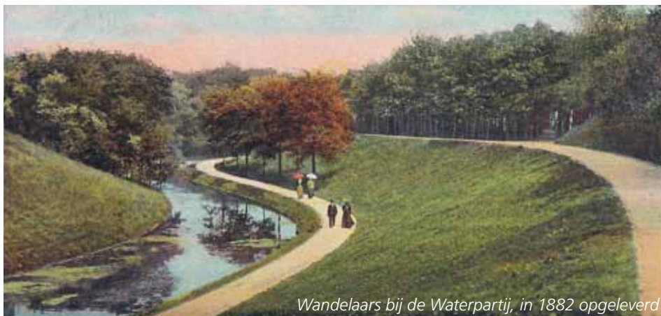
Wandelaars bij de Waterpartij, in 1882 opgeleverd

hard. Maar dat was dan ook wel zo'n beetje de grens met de bewoonde wereld. Daarachter lag de 'pure natuur' van het Scheveningsche Bosch. Natuurlijk werd het bos doorsneden door de tolweg die de stad met het dorp Scheveningen verbond, maar verder hier geen afgravingen en uitsluitend wat villa's aan het einde van de weg. Men beseftte dat men zuinig moest zijn op het gebied waar men zo mooi kon wandelen. De 'schone wandeling' waar Den Haag zo trots op was.