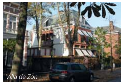
Villa de Zon

Een recent voorbeeld van moderne architectuur als sieraad van het villapark is De Zon, aan de Parkweg.