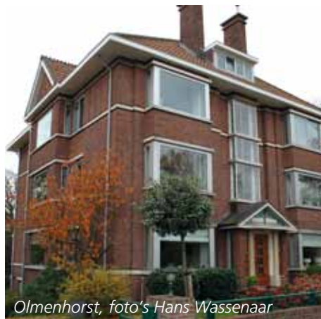
Olmenhorst