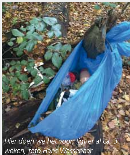
Hier doen we het voor, ligt er al ca. 3 weken

Aanpak: in twee groepen van max. 3 personen het park doorlopen; linkershelft van het park en rechterhelft van het park, tot aan de Shell-pomp.