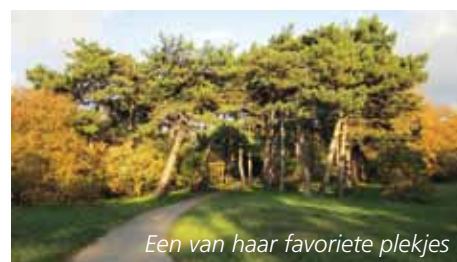
Een van haar favoriete plekjes