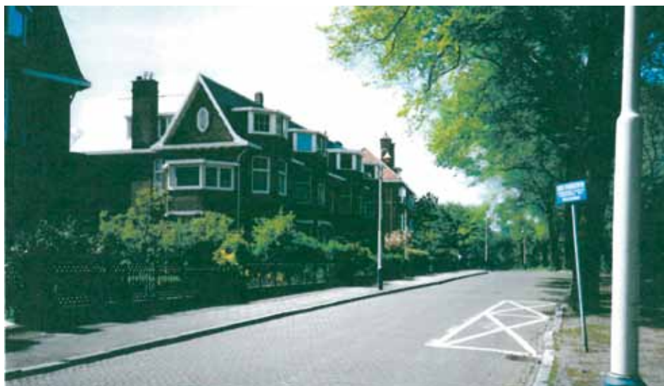
Voorjaar 1992 - een autoloze Gerbrandyweg.

Er zijn ook consequenties voor de parkeermogelijkheden op straat. Voor de straten met parkeerhavens (Duinweg, Parkweg, Hogeweg) verandert er niets. In de straten of straatdelen zonder parkeerhavens zal het parkeren beperkt worden tot één zijde van de weg. Het parkeren op stoepen en hoeken wordt niet meer gedoogd. Het voorstel van de gemeente is als volgt: Prof. Gerbrandyweg parkeren aan de groenzijde van de straat, Belvédèreweg aan de huizenkant