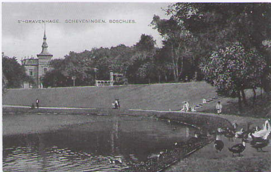
Waterpartij -de 'eendjesvijver', op de achtergrond Villa Devonia.

Lindo dringt aan op verbetering van de situatie.