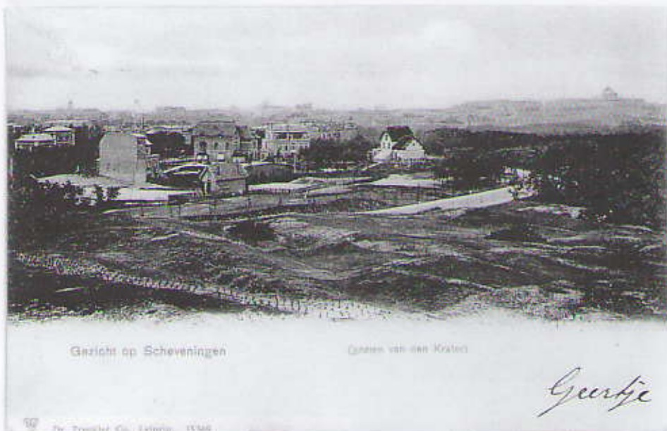
Gezicht op Scheveningen