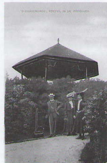
Een kleiner koepeltje, even achter de Promenade.

peltje, even achter de Promenade, dat ook zeer geliefd was, en waar menigeen zich liet fotograferen. Aan de beplanting van de Scheveningse Bosjes werd destijds veel tijd