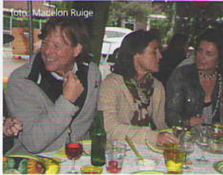
Na afloop van het kinderfeest, borrel en gezellig samen eten.

Van het bestuur: U hebt allen een flyer in de bus ontvangen en vast al gereageerd. Mocht u uw kind(eren) of uzelf nog niet hebben aangemeld en toch willen meedoen met het leuke buurtfeest, mail dan vandaag nog naar vanstolkfeest2012@gmail.com en vraag of dat nog kan.