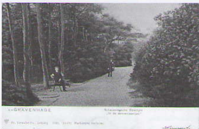
Scheveningse Bosjes, Dennenlaantje.

Het is duidelijk, het advies is afwijzend, en