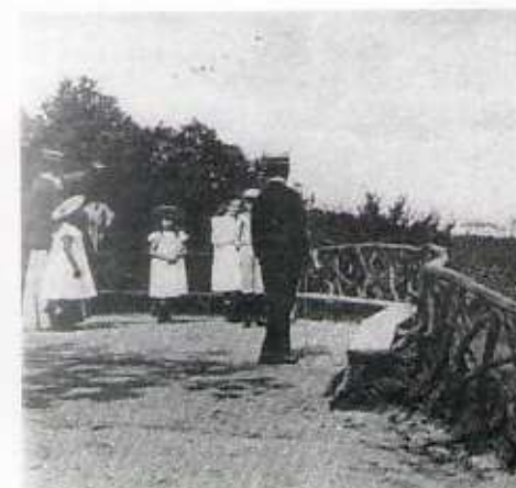
De ronde bank boven aan de 72 trapjes, met uitzicht op het Kurhaus en de badplaats Scheveningen