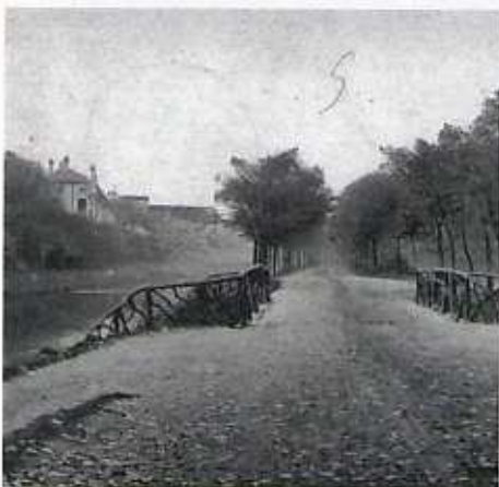
De knuppeltjesbrug over de vaart van het Kanaal naar de Waterpartij