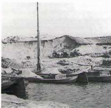
Zandschepen in het Schevenings Kanaal