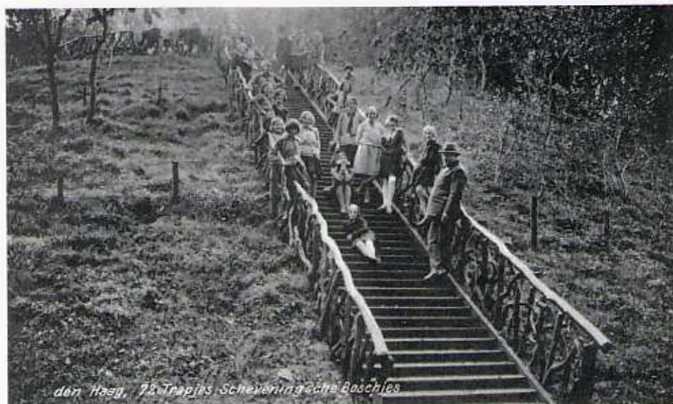
De 72 trapjes, altijd vol met mensen ...

Met het graven van de waterpartij, waarvoor de gemeentearchitect Van der Waeyen Pieterse het ontwerp maakt, wordt in 1868 een begin gemaakt. Al in februari dient Van der Waeyen Pieterse een plan in voor een rustique brug over de te graven vaart of sprank naar de Waterpartij. Deze brug zal in de wandeling de "knuppeltjesbrug" gaan heten, omdat de leuning van boomtakken vervaardigd worden. De vaart heeft in 1869 al een lengte bereikt van 232 meters. De voortgang in 1870 bedraagt 71 strekkende meters en in 1872 87 strekkende meters. In 1873 is de het graven van de vaart gevorderd tot het punt dat ook aan het graven van de grote kom kan worden begonnen. De toekomstige waterpartij heeft dan inmiddels een oppervlakte van 2150 m 2 . Het zand, afkomstig van de vergravingen wordt gebruikt voor versteviging van de