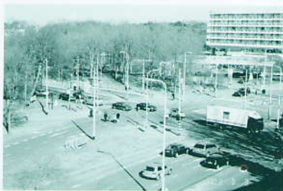
Kruising Scheveningsweg en Teldersweg, foto van Ton Landbeer

Voor de Koerier zoekt het bestuur een eindredacteur. Vanuit het bestuur en de commissies worden voldoende berichten voor de Koerier aangeleverd en mevrouw Anneke