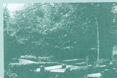
Oud Eik en Duinen. Foto uit het periodiek van de Haagse Bibliotheek

Een begraafplaats is als een mooie tuin of een rustig park, waar je langs aangelegde paden de graven passeert van talloze doden. Een bezoek aan een kerkhof als een ode aan