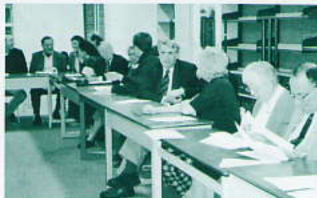
Geanimeerde gesprekken tijdens de pauze van de ledenvergadering.