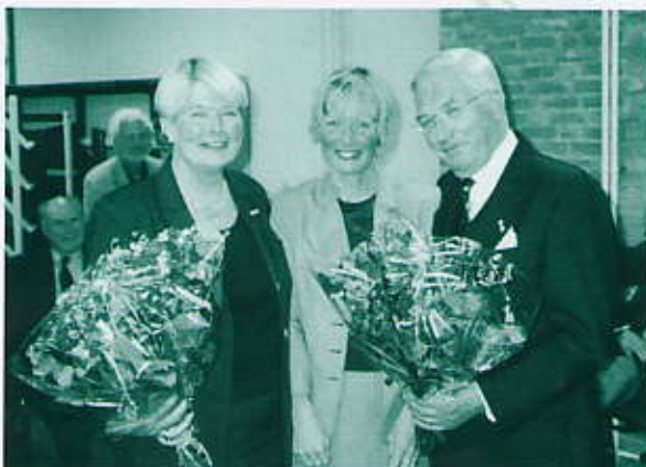
De titel ere-echtpaar van de wijkvereniging bezegeld met bloemen uit handen van de voorzitter.