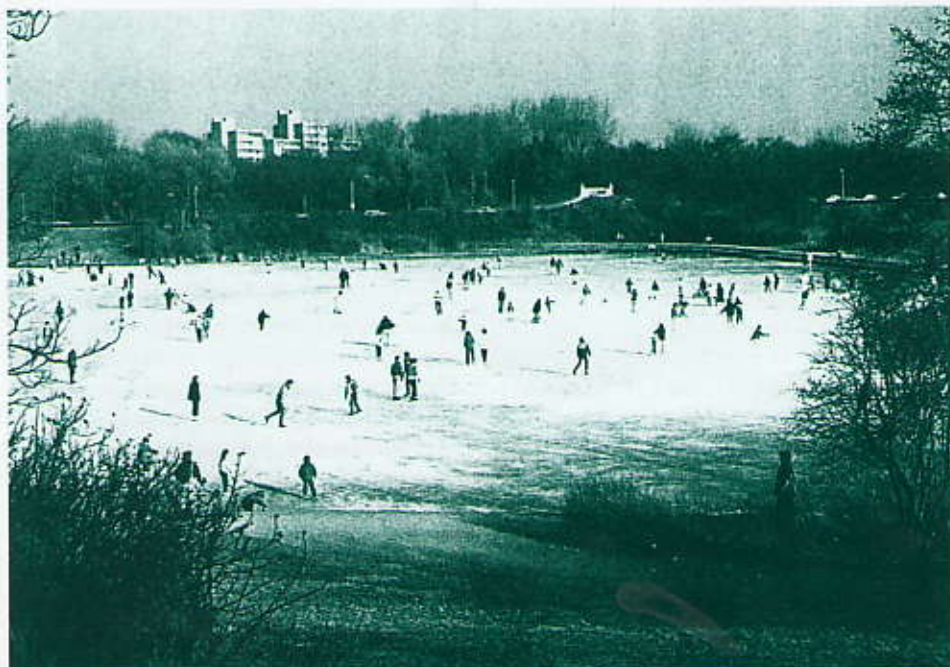
Waterpartij in de winter, met uitzicht op de Ver Huellbank (1986).