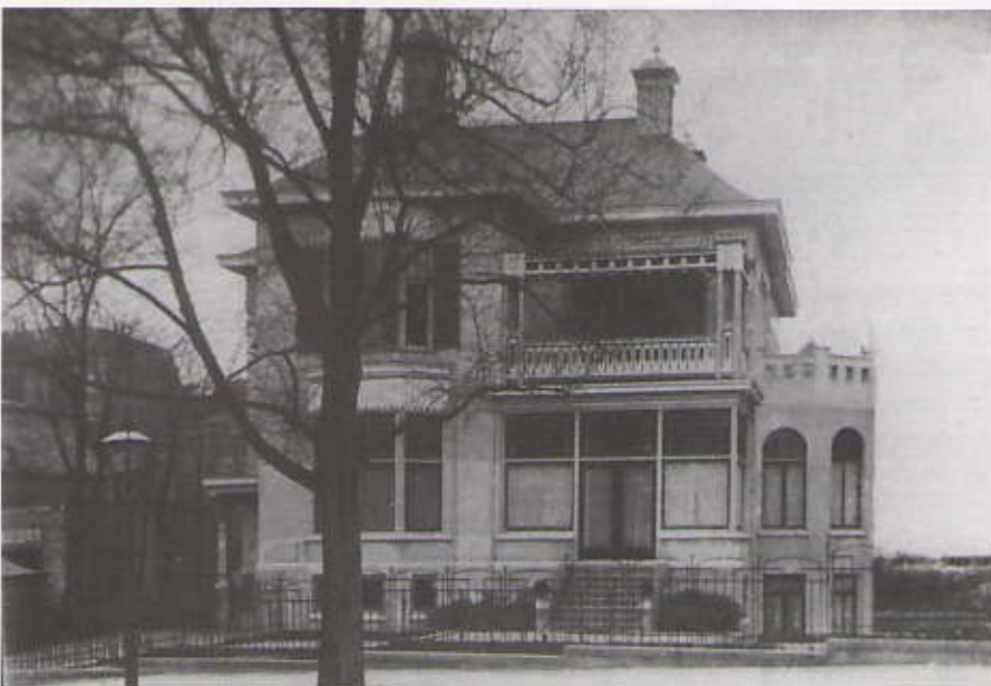
Sonnehoeck op een vergeelde foto uit 1915

Stolkweg. Op de hoek van de Duinweg en de Kanaalweg ligt de tuin, die niet bebouwd mag worden. De villa is zo ruim dat mejuffrouw Van Reijn Snoeck