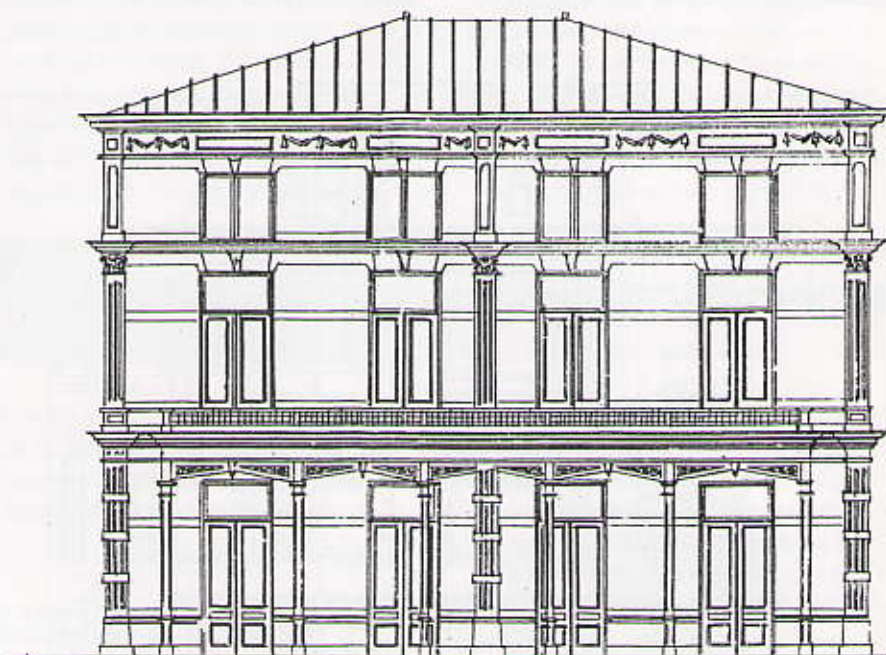
Voor- en zijgevel van Villa Panorama op de hoek van de Van Stolkweg en de Duinweg