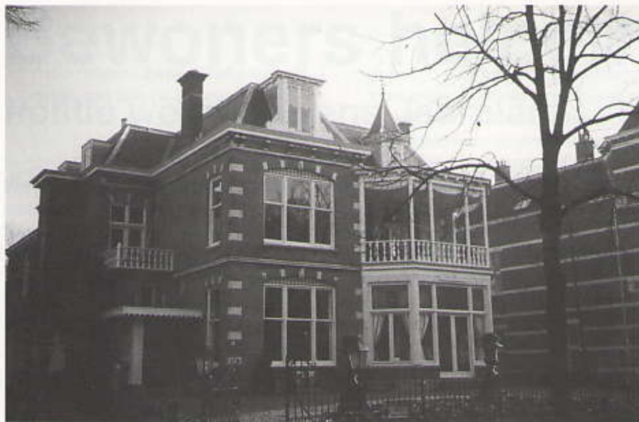
Van Stolkweg 15 a , fraai gerestaureerd