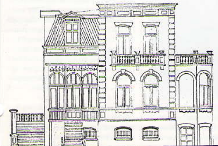
Villa Vinéta, het latere Sonnehoeck, tot de verbouwing in 1913