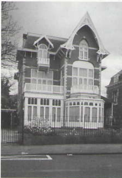
Villa Austria krijgt een nieuw dak. Zie Bouwen, breken en behouden voor meer actueel nieuws over de wijk