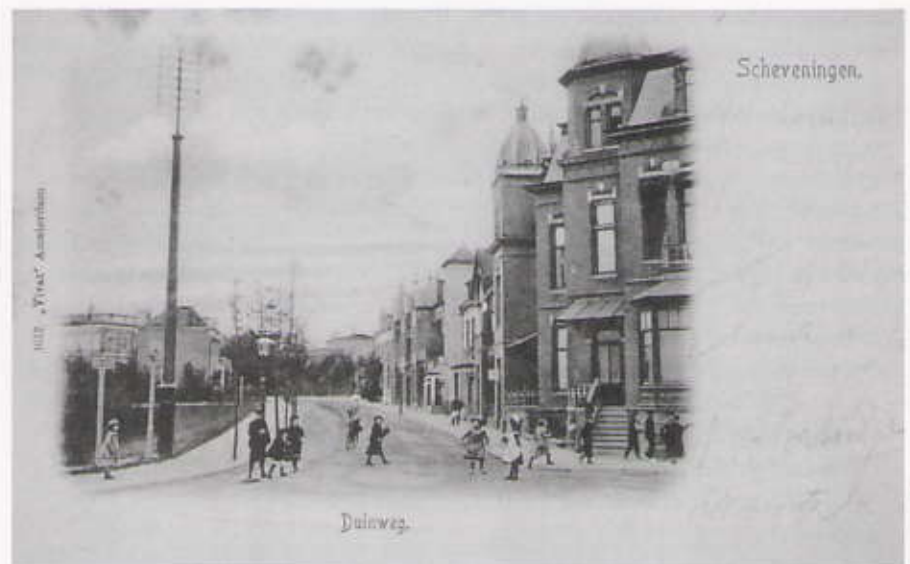
Villa Intimis circa 1900. Linksboven, gezien vanaf de Duinweg

Het duurt niet lang voordat op het terrein op de hoek van Duinweg en Kanaalweg de bouwwerkzaamheden beginnen. In maart 1938 zijn de huizen, gebouwd in de voor de jaren dertig karakteristieke Haagse stijl, klaar. De huizen gaan grif van de hand, waarbij de huizen aan de Kanaalweg meer in trek zijn dan de huizen aan de Duinweg. De negen huizen brengen per stuk bedragen op tussen de f 12.000 en f 25.000, bij elkaar voor f 156.000. De huizen die niet direct verkocht worden verhuurt Zaaijer, zoals Kanaalweg 113c, dat in 1939 voor f 1200 per jaar verhuurd wordt aan de pasbenoemde minister van Justitie Professor P.S. Gerbrandy. Kanaalweg 113a wordt verhuurd aan Dr. J.J.E. Hondius, rector van het 1e VCL. Zijn weduwe, mevrouw J.H. Hondius-Swart, en zal er tot aan haar overlijden in 1978 wonen. Na het overlijden van Professor Gerbrandy in 1962 wordt dit stuk van de Kanaalweg naar hem vernoemd. De onhandige huisnummers 113a tot en met 113f worden pas in 1970 veranderd in 1 tot en met 13.