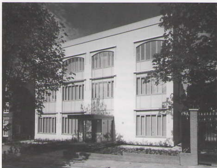
Duinweg 20-22, onlangs gekocht door de ambassade van Iran

Norah, de noordelijke randweg, komt er. Alleen over de manier waarop deze weg door het Hubertusduin gelegd zal worden moet nog een beslissing genomen worden. De aanleg van de Norah, een afslag van de A4 bij Voorburg, die aan de andere kant een nieuwe verbinding krijgt met Zoetermeer, heeft ook zijn gevolgen voor de noordwestelijke hoofdroute die loopt van het