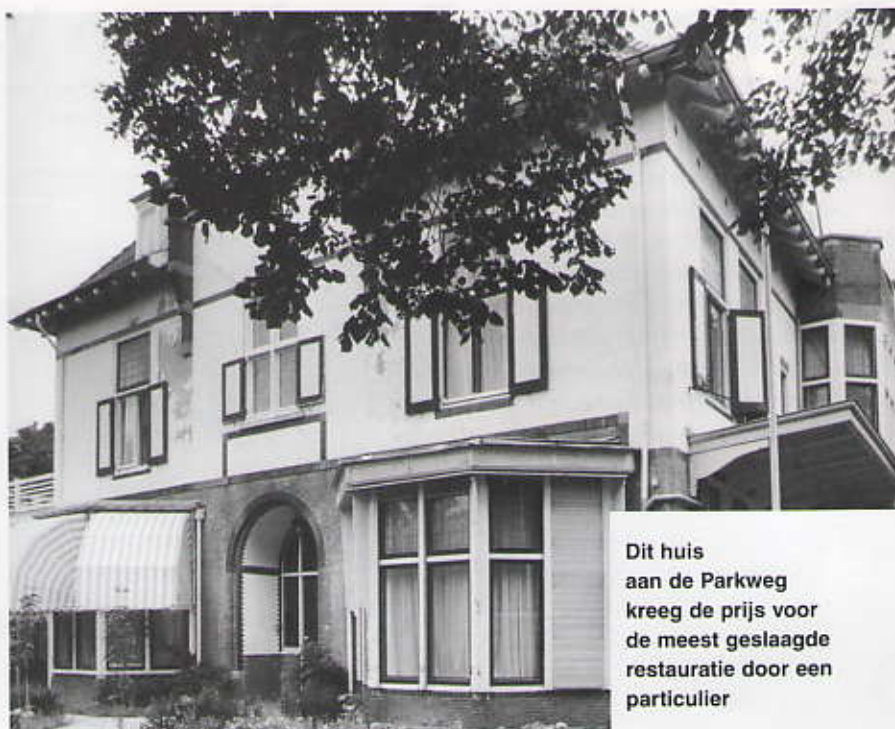
Dit huis aan de Parkweg kreeg de prijs voor de meest geslaagde restauratie door een particulier

Toch moet er zo af en toe weer op gewezen worden dat dit in een beschermd stadsgezicht ook volgens bepaalde regels gaat. Bij de splitsing in appartementen van Van Stolkweg 34 leek het even fout te gaan: het rechter zolderraam kreeg niet de maatvoering die in het bouwplan was afgesproken.