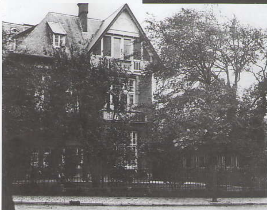
Villa Orania, rechts Villa Insulinde

Bronnen: Kadaster 's-Gravenhage Bevolkingsregister