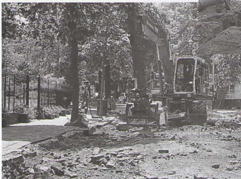
Verwijderen asfalt en puinfundering