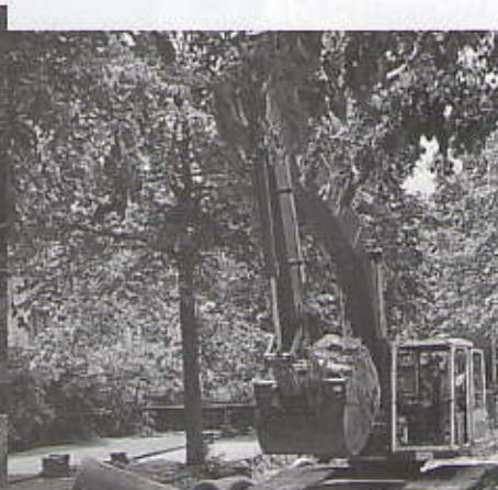
Het aanbrengen van een zandlaag. Links de afvoer van een oude waterleiding