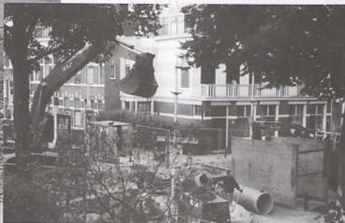
Put kruispunt Gerbrandyweg