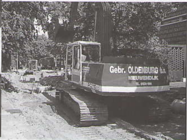
Kraan neemt oude riool uit en plaatst nieuwe. Kleine kraan plaatst huisaansluiting