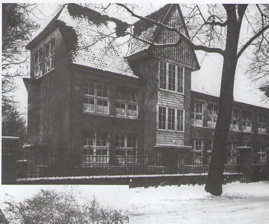
Eerste uitbreiding VCL

Met de koop van het terrein van Villa Hendrika in 1949 en van Villa Insulinde in 1953 is het VCL eigenaar van het gehele terrein. Met plannen voor de uitbreiding waar de school op dat moment dringend behoefte aan heeft, kan men nu een begin maken. De uitbreidingsplannen, die in 1958 gereed zijn, stuiten op veel bezwaren