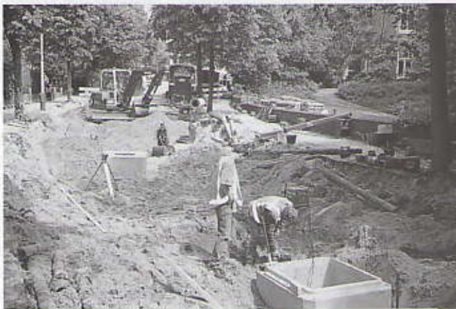
Zorgvuldig inmeten

Naar verwacht is de Van Stolkweg rond 20 september weer begaanbaar; de Gerbrandy- en Belvédèreweg eind september. De Rusthoekstraat en de Haringkade zijn op 8 en 18 oktober