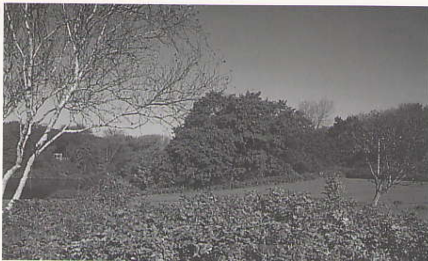
(lr. B. Steinmetz)