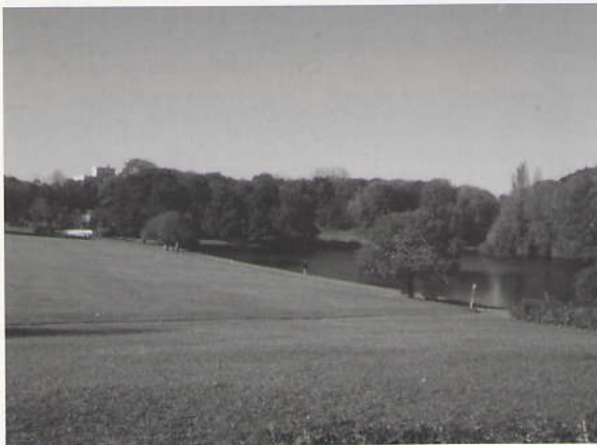
(lr. B. Steinmetz)

Een herinneringscentrum tegenover Indisch monument bij Waterpartij?