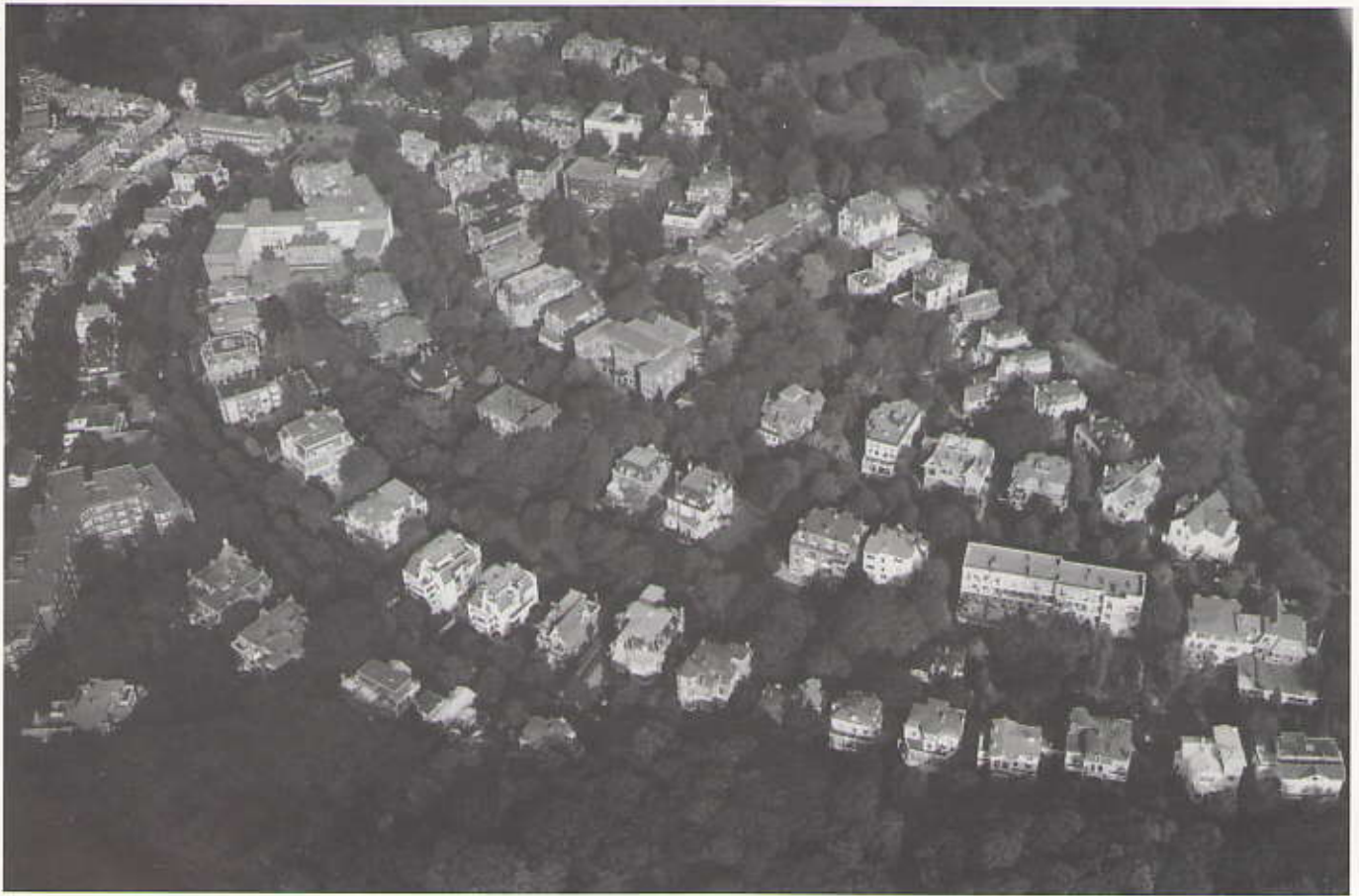
Uw huis vanuit de lucht op foto 1 kunt u bestellen bij International Promotions B.V. Zie pag. 12