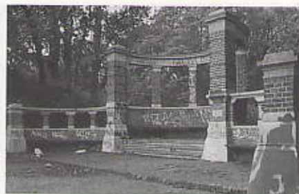
Romantisch op de Belvédère gelegen: de Cremer-bank, opgericht voor de schrijver van Betuwse novellen J.J. Cremer