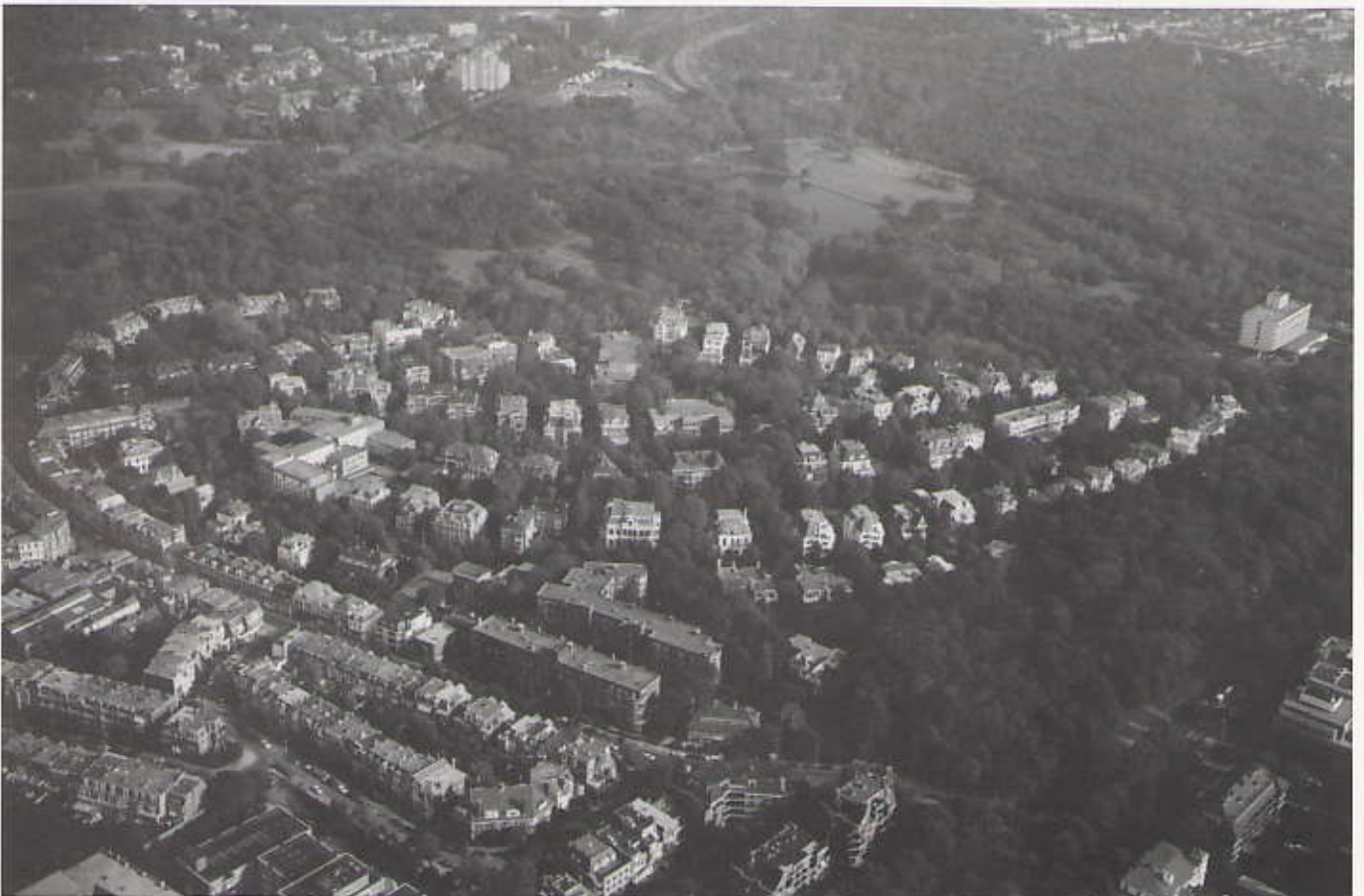
Uw huis vanuit de lucht op foto 2 kunt u bestellen bij International Promotions B.V. Zie pag. 12