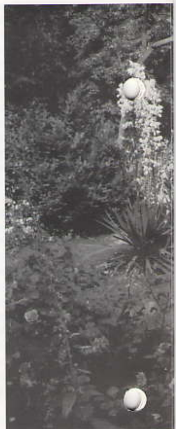
Winnende tuin, Van Stolkweg

De voortuin van tweede-prijswinnaar Parkweg 38 is een visitekaartje met kleur en glans voor de vele bezoekers van Gerding Tandtechniek BV. En met verrassingen, want vanaf de weg zijn de