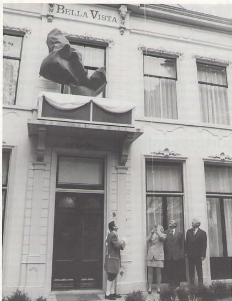
(Van Galen, Oudijk)