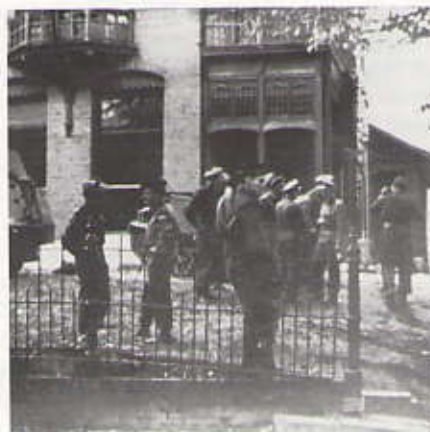
Tuin Villa Insulinde

voor f 39,50 bij Museum Scheveningen en bij de boekhandel. Voor sommigen zullen de foto's een herinnering zijn, voor anderen een ontdekkingsreis door de tijd. Dat geldt ook voor het fraaie fotoboek waarin Wim de Koning Gans een beeld geeft van de badplaats tussen 1860 en 1960 aan de hand van tientallen, veelal niet eerder gepubliceerde foto's. (Museum en de boekhandel, f45)