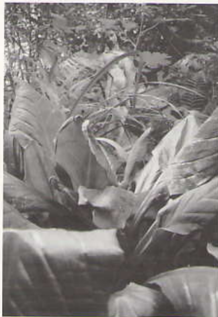
Tussen het groen bij de vijver

Vanaf de open plekken zie je rozen kruipen door de exotische apeverdrietboom. Twee exemplaren van deze Araucaria araucana uit Chili, met donkergroene, leerachtige, scherpgepunte bladeren, trof Else voor het huis aan toen ze in de Hogeweg kwam wonen. Ze waren erg in de mode in de tijd dat het Van Stolkpark werd aangelegd. Voor de voorbijganger staan de hortensia's uitbundig te bloeien: de viltige Hydrangea aspera var. sargentiana ; een macrophylla -soort met platte lilawitte tulen; een hortensia met dieproze ronde tulen en zelfs een blauwe. De duingrond zal hem na enige tijd wel roze kleuren.