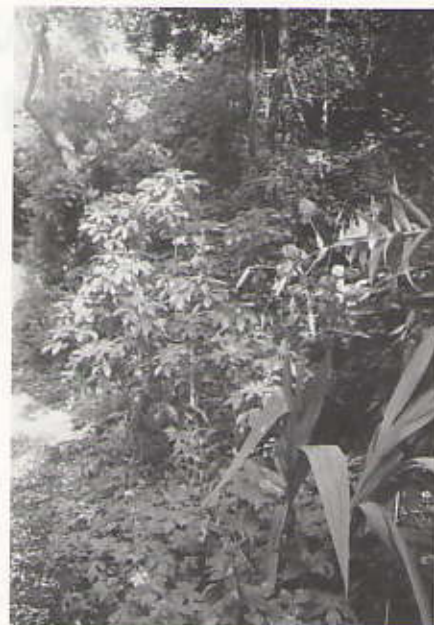
Het pad langs het huis

Overal staan elegant lelies op lange stelen. Oranje, gele en witte. Ooievaarsbekken van licht- tot donkerpaars kruipen onder de bomen tussen