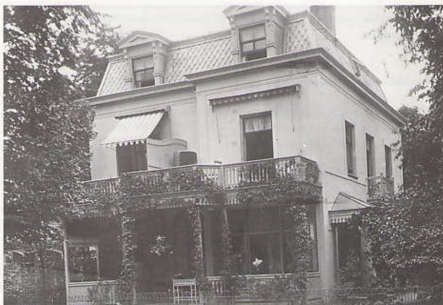
Bij Villa Mignon, Van Stolkweg 26 (architect H. Wesstra, 1885) is het na-oorlogse spijltjesbalkon vervangen door een houten balkon, gemaakt aan de hand van oude foto's van de villa (Gemeentearchief)

kantoor uitgevoerd. Het zal nu niet meer zo eenvoudig zijn om er weer appartementen van te maken, als de MAB het pand over enkele jaren weer zal verlaten.