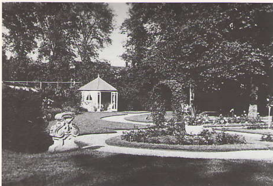
Hoewel Copijn als regel weinig gebruik maakt van bouwkundige elementen, waren er toch enige tuinbanken, een prieeltje, rozenpoortjes en tuinvazen in de tuin van Villa Olanda

rijkversierde gevel bijzonder mooi uitkomt door de verlichting.