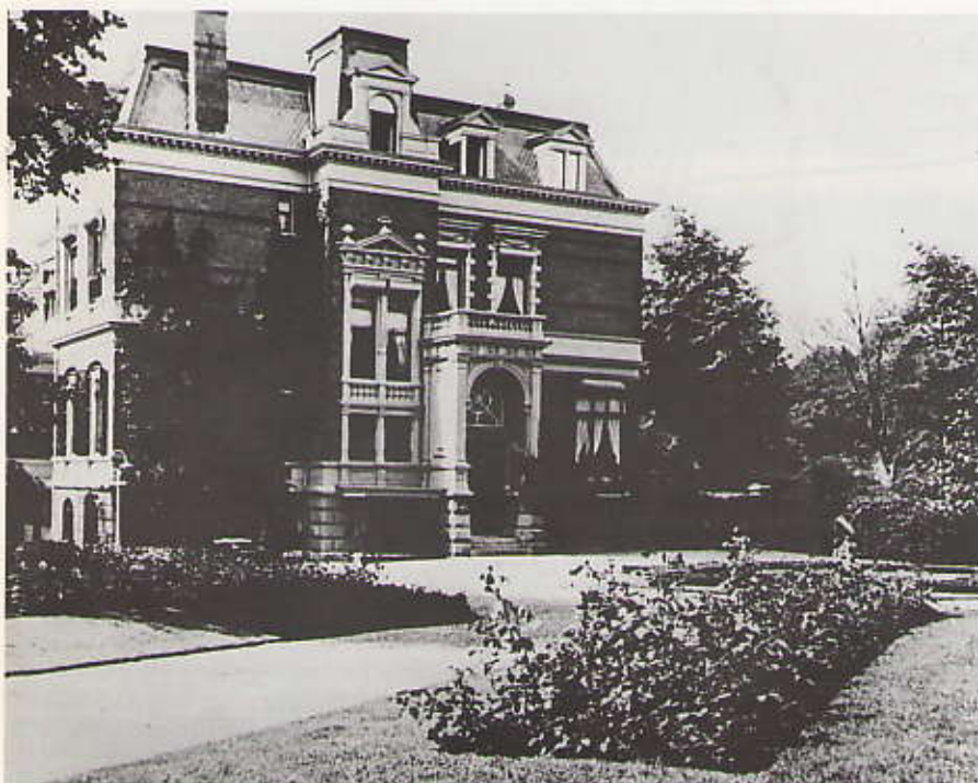
Villa Olanda

Niet alleen is Olanda het fraaiste huis van de wijk, het lag temidden van een landgoed dat 1 hectare, 54 are en 5 centiare groot was en zich uitstrekte van de Kanaalweg tot aan de Parkweg.