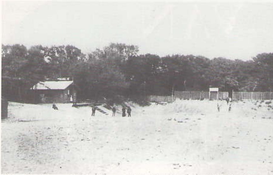
De 'overtuin' tegenover Hôtel de la Promenade