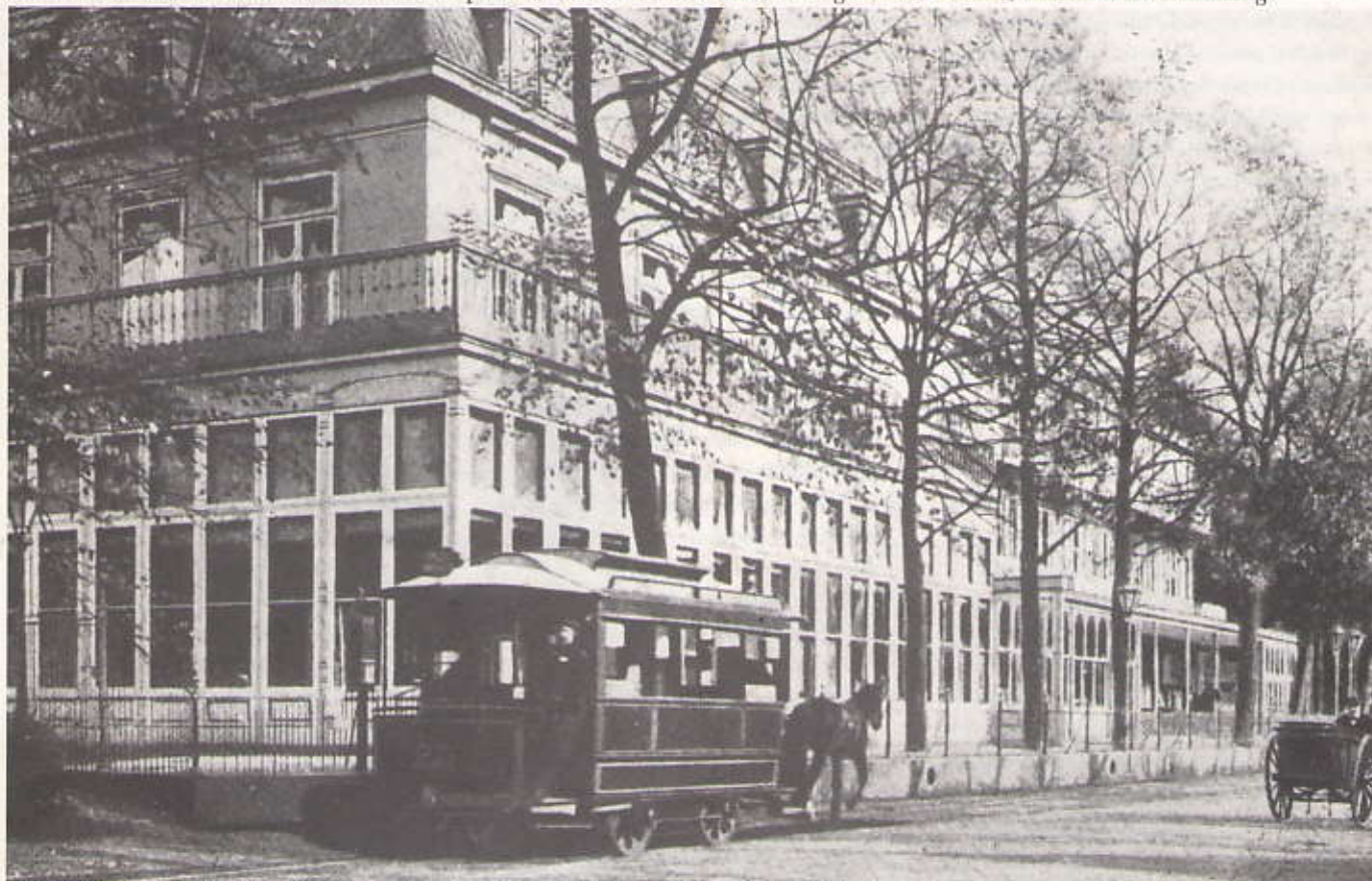
Hôtel de la Promenade met op de voorgrond de paardetram

Overnemen uit de inhoud van de Van Stolkparkkoerier alleen met toestemming van de redactie, èn met bronvermelding