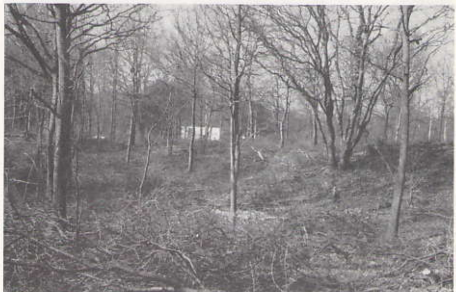
Op een behoorlijke afstand van de Teldersweg is deze al zichtbaar

Een belangrijk punt van de Groennota is het streven naar herstel van verbindingen in, naar en tussen stadsparken. Volgens de nota wordt de samenhang tussen aan elkaar grenzende groengebieden door diverse wegen verstoord. Met het oog daarop moet het doorgaande verkeer op de Duinweg, Haringkade, Ver Huellweg en Dr. Aletta Jacobsweg worden teruggedrongen (deel 1, p. 42). Wat betreft het beheer: de bossen bestaan uit wijkers en blijvers. Soorten als de populier groeien snel en bieden beschutting, maar moeten weg als de blij-