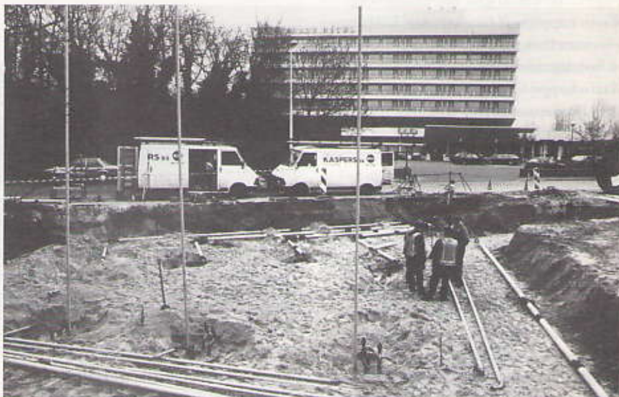
Het begin van de werkzaamheden voor het Shell station Promenade

Het bouwplan begint vastere vormen aan te nemen. Toch zijn de Welstandscommissie, en wij, er nog niet helemaal gelukkig mee. Het voorplein zal volgens de laatste tekeningen bestaan uit een