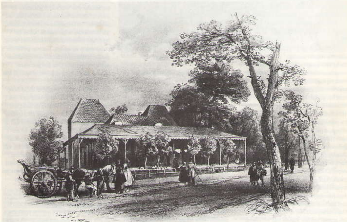
Het Paviljoen Klein Zorgvliet aan de Scheveningseweg rond 1839.

Overnemen uit de inhoud van de Van Stolkparkkoerier alleen met toestemming van de redactie, en met bronvermelding.