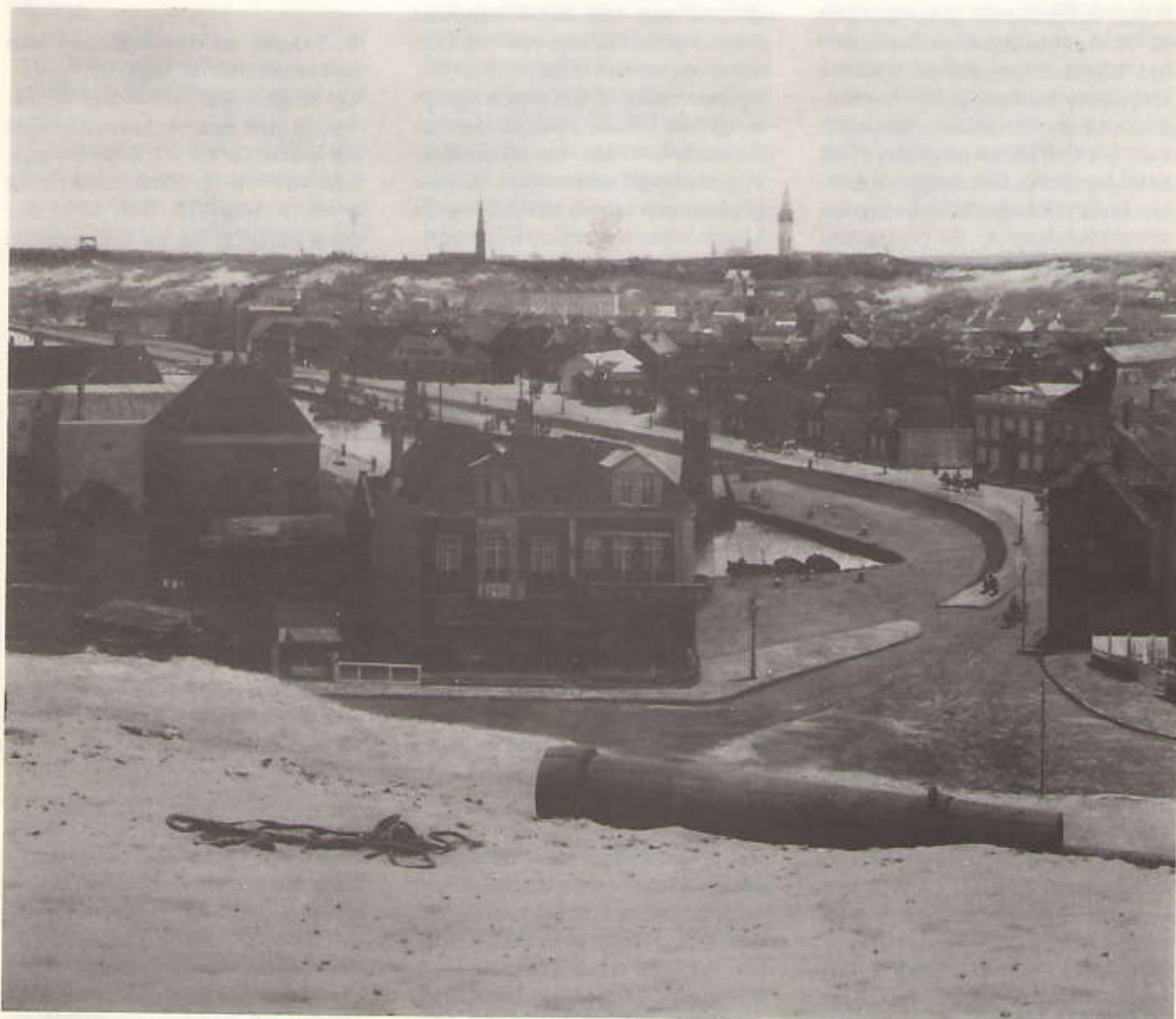
Panorama Mesdag - gezicht op Den Haag. Zie verder pagina 18.

Overnemen uit de inhoud van de Van Stolkparkkoerier alleen met toestemming van de redactie, en met bronvermelding.