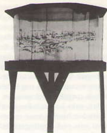
Mesdags glazen cylinder (uit: Het Panorama fenomeen , p. 104)