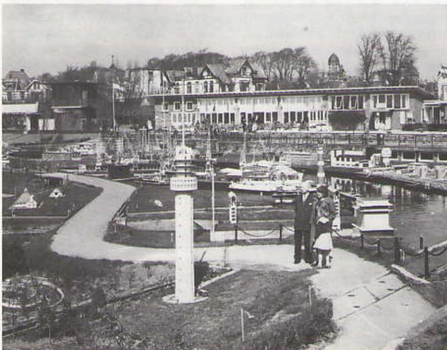
Haven met televisiemast in Madurodam rond 1960. Op de achtergrond staan nog de fraaie villa's die plaats hebben moeten maken voor de Résidence Wittebrug

Enkele dagen daarvoor, op 29 maart, hadden de gemeente en Madurodam officieel bekend gemaakt het uitbreidingsplan voor de miniatuurstad te heroverwegen. De brede maatschappelijke bezwaren tegen dit plan leidden tot de conclusie 'dat het verstandig is de mogelijkheden van alternatieve oplossingen voor de uitbreidingsbehoefte van Madurodam te bezien'. De gemeente Den Haag zegde toe binnen drie maanden daarvoor de nodige voorstellen te doen, dus vóór eind juni. Madurodam verklaarde zich 'bij voorkeur te richten op een geschikte vestigingsplaats in Den Haag'. De tervisielegging van het ontwerp-bestemmingsplan Scheveningse Bosjes, waarin de uit-