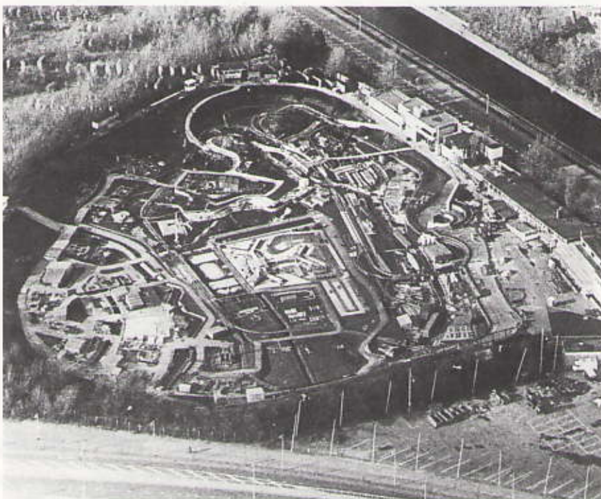
Madurodam vanuit de lucht

Blij omdat schijnbaar onwrikbare standpunten onverwacht en als bij donderslag een mate van spelling blijken te vertonen.