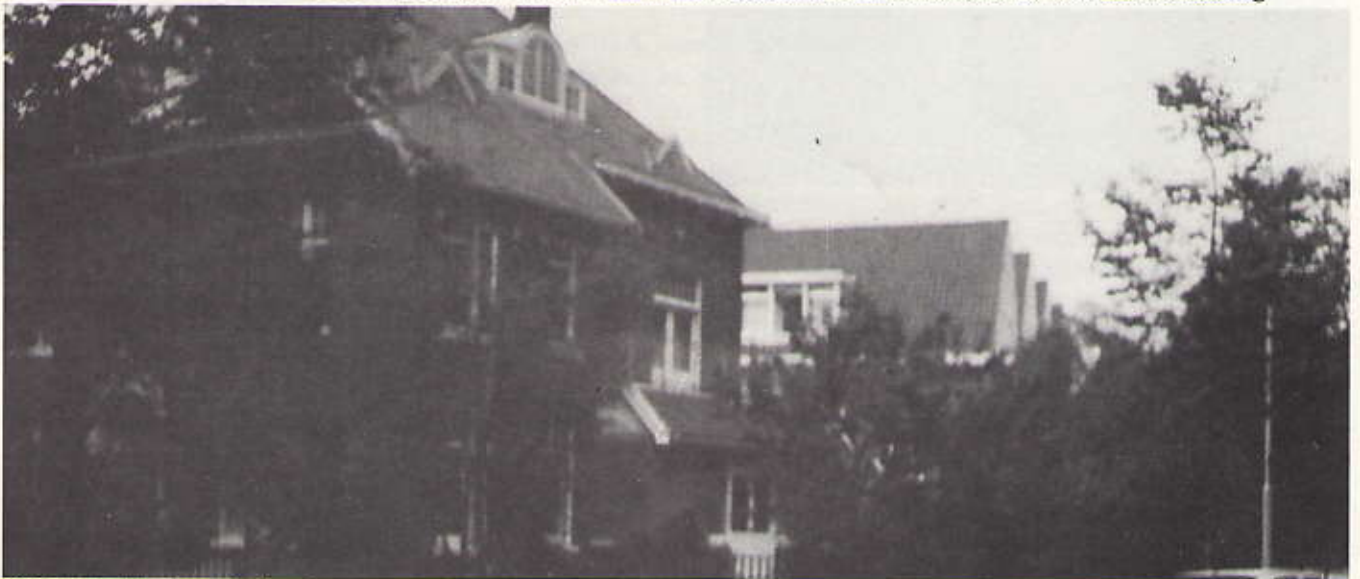
Villa Vredelust op de hoek van Duin- en Belvédèreweg. Heel duidelijk is te zien hoe de erker is dichtgemetseld.

Overnemen uit de inhoud van de Van Stolkparkkoerier alleen met toestemming van de redactie, en met bronvermelding.