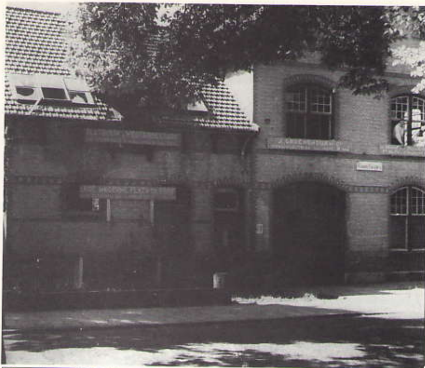
Kanaalweg 115 vlak voor de afbraak in 1953