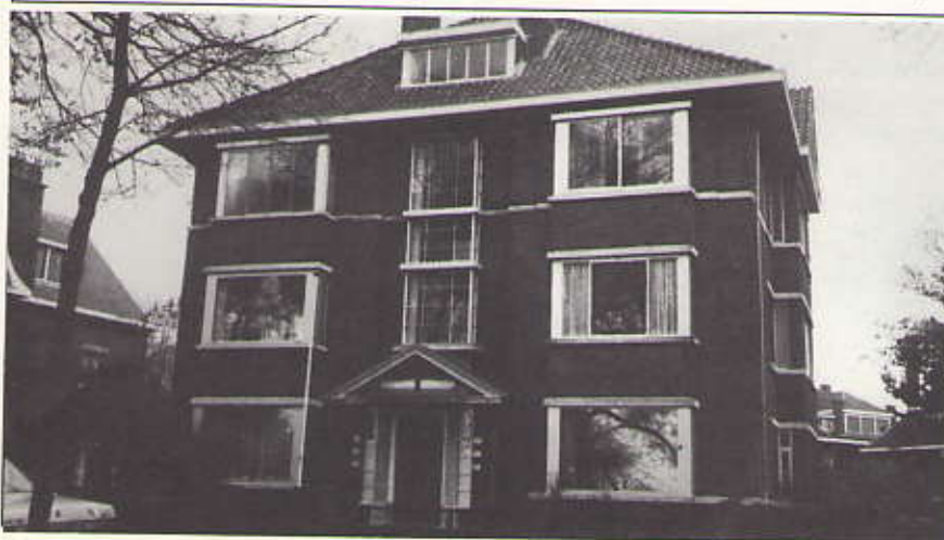
Van Stolkparkkoerier 49