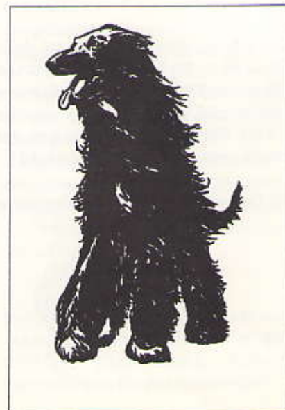
Van Stolkparkkoerier 49

Op ALLE andere plaatsen wordt van de Haagse burgers verwacht dat zij hun hond aan de lijn laten lopen. Dat geldt dus ook voor het Belvédèreduin.