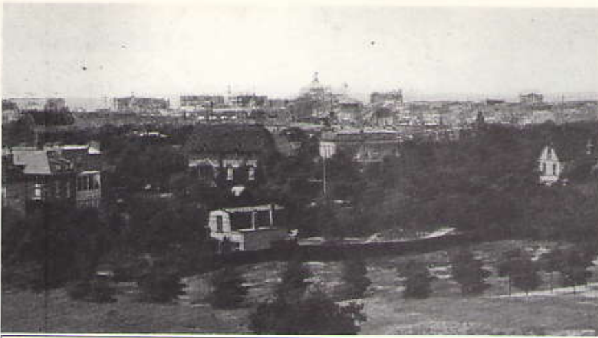
Uitzicht vanaf de Belvédère. Op de voorgrond een inmiddels gesloopt huysje, gelegen aan de rand van de huidige erfscheiding tussen de huizen aan Duin- en Belvédèreweg. Achter het huysje de achtergevels van v.l.n.r. Duinweg 14, 12, 10 en 8, Villa Lunia, Villa Intimis en uiterst rechts het koetshuis van Lunia aan de Kanaalweg. Op de voorgrond loopt de nog onbebouwde Belvédèreweg (omstreeks 1910).