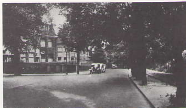
L.b.: Prof. Gerbrandyweg 117 tot en met 125 (Foto Anneke Landheer). R.b.: De hoek van Belvédèreweg en Kanaalweg rond 1950. L.o.: Duinweg 4b, 4c en 6 (Foto Anneke Landheer). R.o.: Duinweg 6a, 6b en 6c (Foto Anneke Landheer).