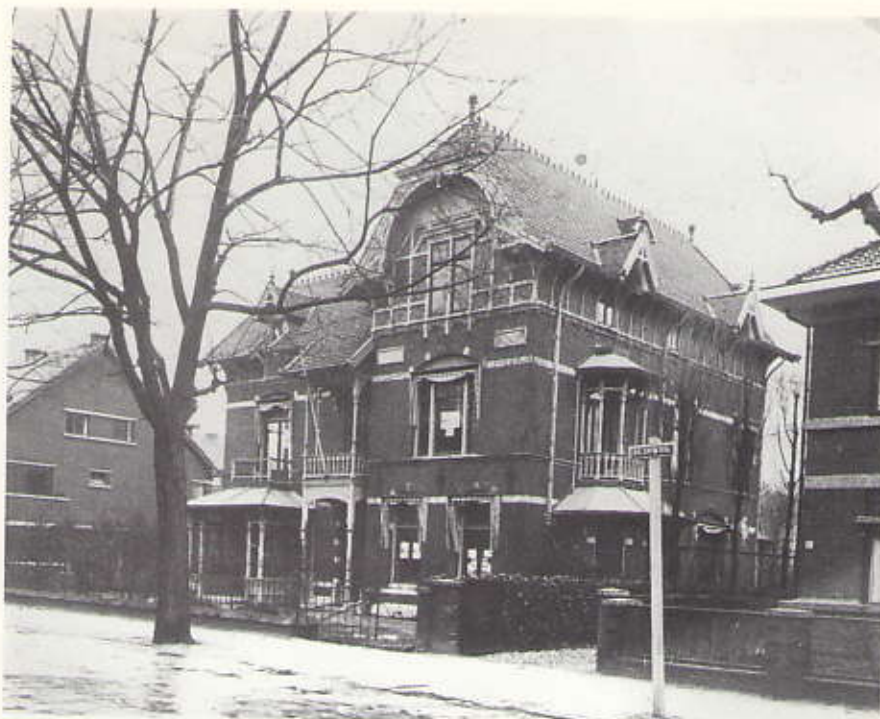
Villa Lunia vlak voor de sloop, in 1939