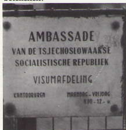
Het bord van de Ambassade van Tsjechoslowakije, Parkweg 1

De afgelopen zomer zal menig een zich afgevraagd hebben wat er toch aan de hand was op de Hogeweg. Verkeerschaos, parkeerproblemen, zoekende mensen met allerlei papieren in de hand en wachtende mensen, ongeduldig in een rij opgesteld, die uren op straat stonden, was de aanblik die de toevallige voorbijganger aantrof in deze anders zo rustige omgeving. Wat had dit allemaal te betekenen?