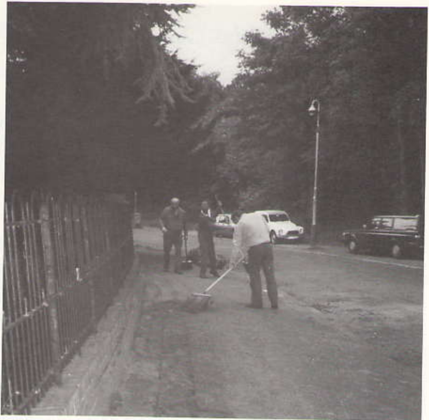
De Belvédèreweg tijdens de schoonmaak . . .

Afgehaald bij het contactadres kosten ze: dassen fl. 22,50 en shawls en chokers fl. 25,-.