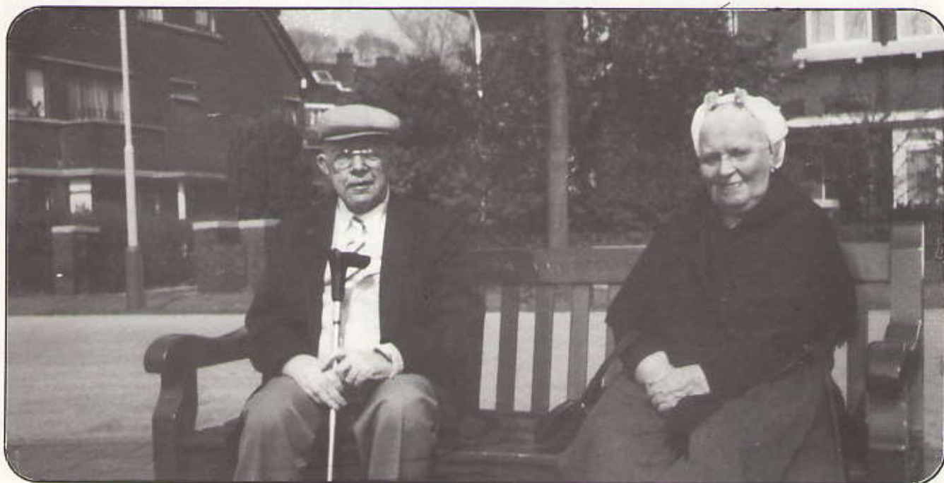
Zomer 1989: genieten op de Thomas van Stolkbank