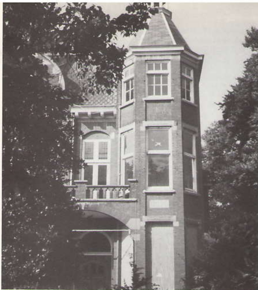
Villa Thera, Van Stolkweg 12a