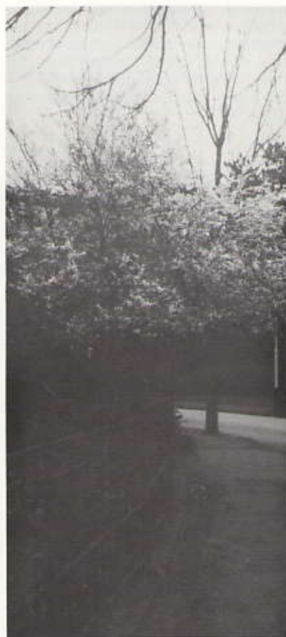
De vroege lengte van 1989 - 22 februari 1989

Overigens werden veel van dergelijke processies door de lokale overheden verboden, nadat in Nederland de Hervorming had plaatsgevonden, maar gezien de noodzaak van een extraatje voor velen, bleek de gewoonte moeilijk uit te roeien. Wel is het een verklaring voor de veel beter bewaard gebleven tradities op dit gebied in de Rooms-Katholieke delen van ons land.