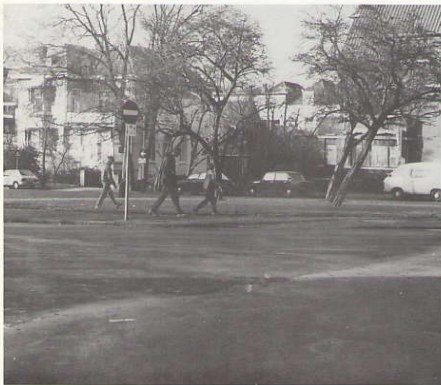
De laatste dag van de meidoorns