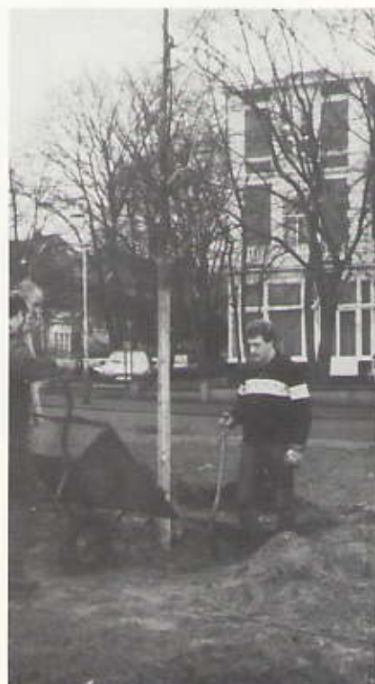
Het planten van de linden, 1 februari 1989