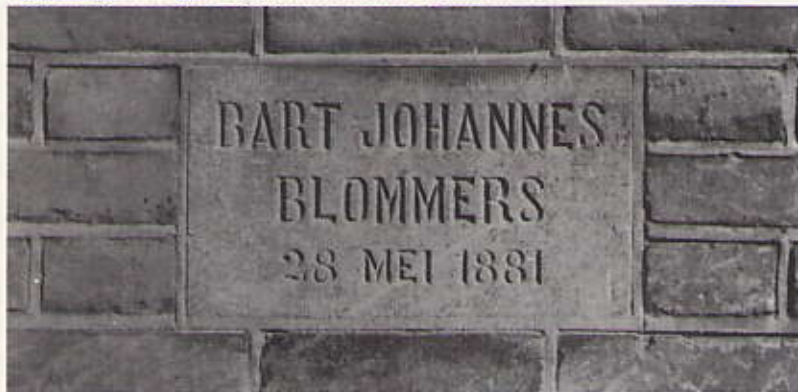
De eerste steen, in 1881 gelegd door de zoon van schilder B.J. Blommers

Op zaterdag 28 mei , om 11 uur, zal de eerste steen van het voormalige pand Van Stolkweg 17, op feestelijke wijze opnieuw worden ingemetseld, maar nu in het pas gereedgekomen appartementengebouw Van Stolkweg 17. De wijkbewoners zijn hierbij uitgenodigd om bij die gelegenheid kennis te maken met hun nieuwe burens.