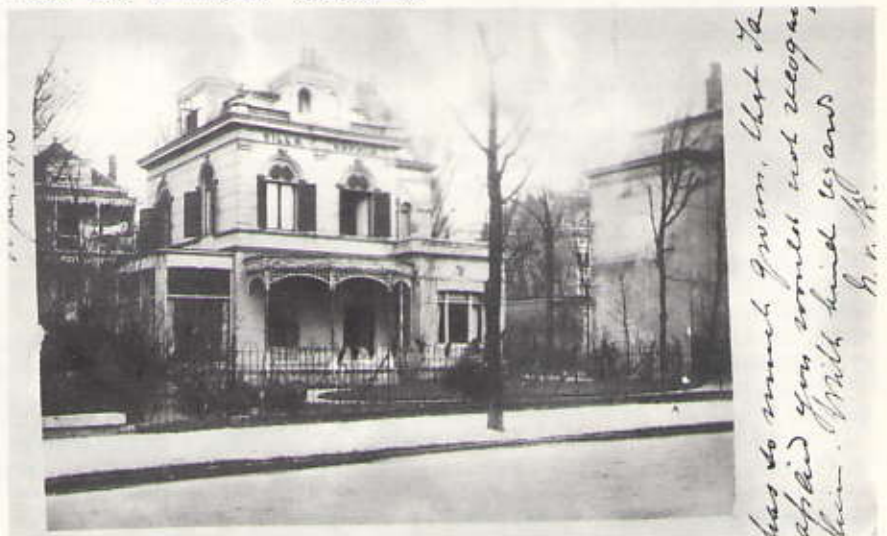
Villa Sophia in 1923