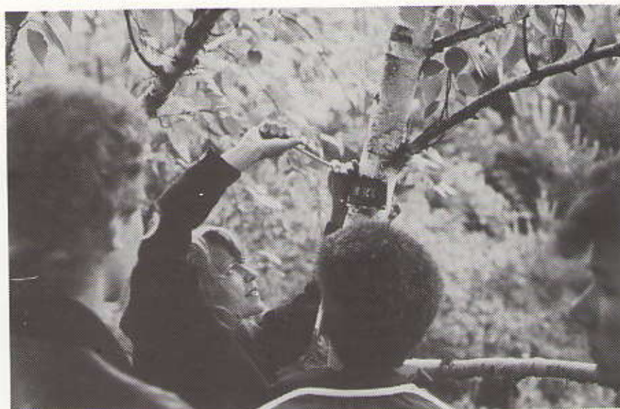
Een scholiere schroeft een naambordje op een berk.

Tijdens de les en ook als huiswerk vervaardigde de klas bordjes van koper, met daarop de namen van alle planten die tijdens de spreekbeurten ter sprake kwamen en die ook in het Westbroekpark staan. Daar heeft onze klas enkele weken geleden met de hulp van een paar mannen van de Haagse Groenvoorziening de naambordjes aangebracht. Toen zaten de naambordjes dus vast op de bomen, of voor zover het de struiken betreft op flinke houten palen, alwaar zij nu te bewonderen zijn.'