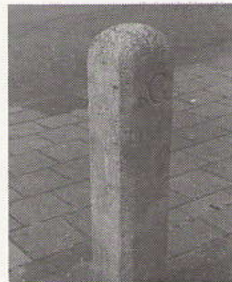
De (Loosduinse) grenspaal aan de Van Stolkweg.