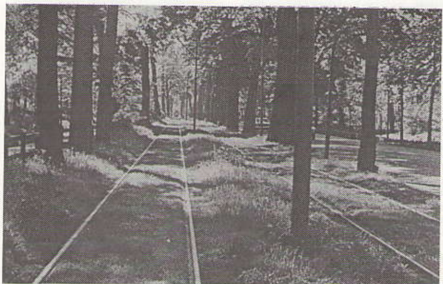
De trambaan langs de Scheveningseweg