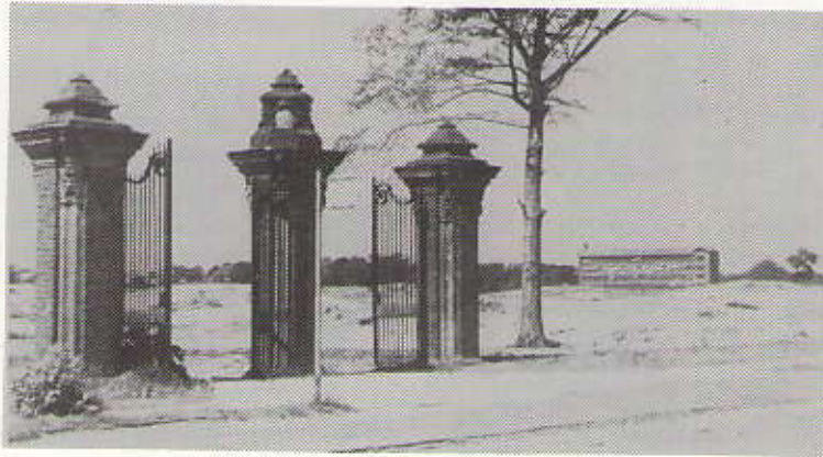
De Scheveningse Bosjes anno 1946: de tolhekken aan de Kerkhoflaan aan het eind van één troosteloze vlakte

genwoordigers van de werkgroep en de Wijkverenigingen 'Zorgvliet' en 'Van Stolkpark'. Mede namens de beide andere organisaties heeft het Wijkoverleg 'Statenkwartier' per brief van 3 januari 1985 gereageerd op de uitgangspunten van de Werkgroep Scheveningseweg en deze in hoofdzaak onderschreven. Ook het aanbrengen van een en dezelfde bij de boomrijke omgeving passende kleur, zowel op de lichtmasten als op de tram-