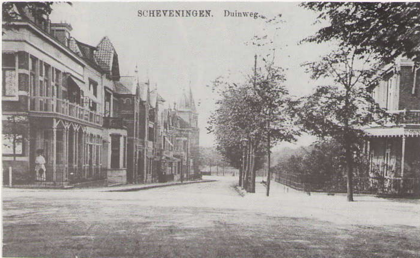
- 1909: een dame heeft altijd voorrang