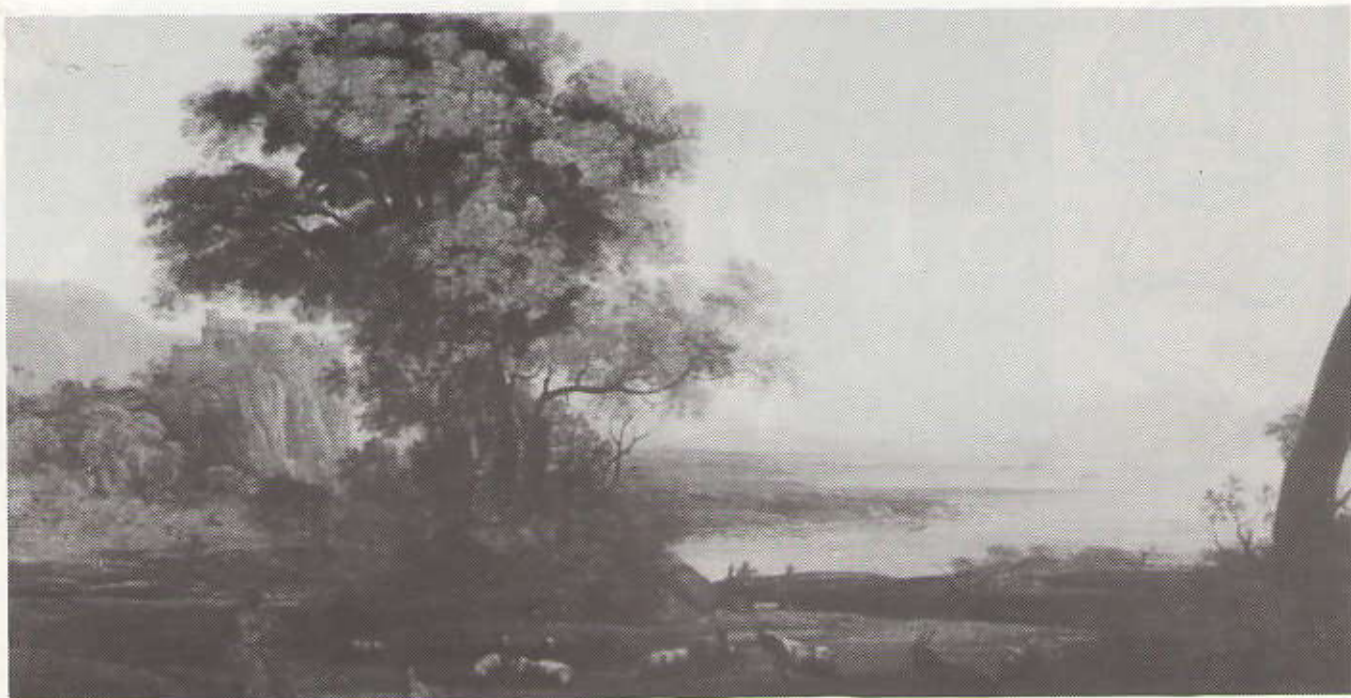
Claude Lorrain. Château de Champagne bij Mirecourt

In nummer 26 van de Van Stolkpark-koerier vertelde ik u over Egyptische tuinen. Dit keer wil ik u het een en ander vertellen over de tuinen van de Grieken. De Grieken zagen zich niet zoals de Egyptenaren genoodzaakt om, als de regentijd met zijn overstromingen voorbij was, al het beschikbare land opnieuw te verdelen, te beplanten en binnen een half jaar te oogsten.