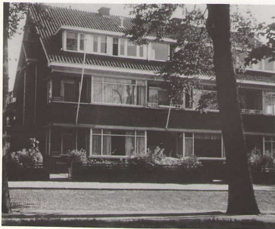
Kanaalweg 113c in 1962 Tekening van Blommers in het Gastenboek van het Kurhaus

onder andere: Particulier Archief Prof. P. S. Gerbrandy, Algemeen Rijksarchief, 's-Gravenhage