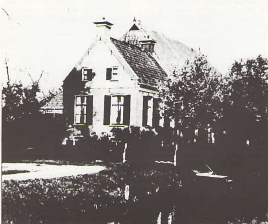
Het geboortehuis van Prof. Gerbrandy in Goëngamieden

Gerbrandy begaf zich elke dag naar het departement van Justitie aan het Plein.