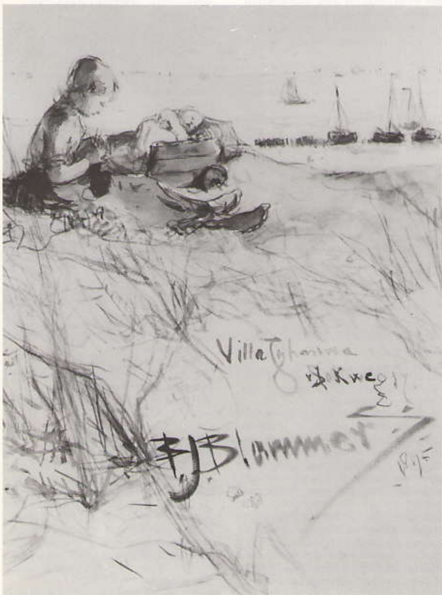
Tekening van Blommers in het Gastenboek van het Kurhaus

Archief Bouw- en Woningtoezicht. Kadastrale leggers (gemeente-Archief)