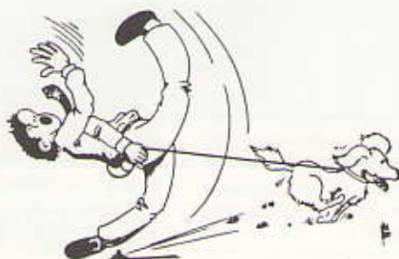
Uit: De Voeg, december 1983.

Twee, drie of meer per gezin is geen uitzondering meer. Ook lijkt het wel, of je als hondenbezitter niet meer in tel bent, als je je beperkt tot het bezit van een echt huisdier dat wil zeggen een hond van bescheiden formaat.