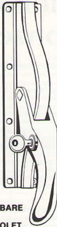
AFSLUITBARE POMP- ESPAGNOLET

Het verdient de voorkeur om vaste en beweegbare delen van binnenuit te beglazen. Wordt echter buitenbeglazing toegepast, dan dienen er maatregelen te worden getroffen om te voorkomen dat de gehele ruit eenvoudig uit de sponning wordt genomen. De glaslatten dienen daarom deugdelijk te zijn bevestigd en mogen niet eenvoudig losgeklikt kunnen worden. Een bevestiging met ééntoers-schroeven is aan te bevelen.