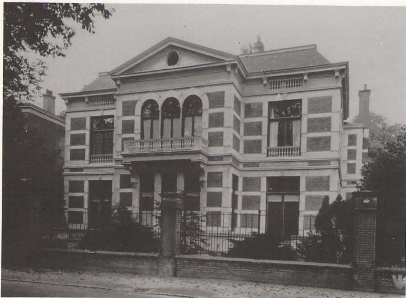
Van Stolkweg 6 in 1949